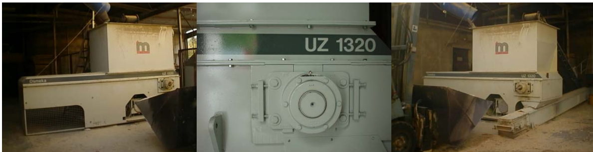
UZ1320 Maschine im Einsatz