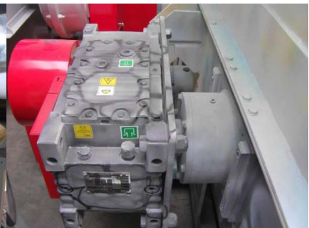
SEW Industriegetriebe und Rotorlager