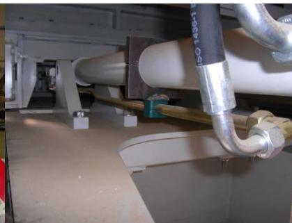
Hydraulikzylinder für Vorschubkasten