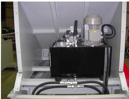
Hydraulikaggregat untergebracht unter dem Fülltrichter: geschützt und gut zugänglich