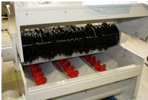
Schneidrotor mit Austragschnecken