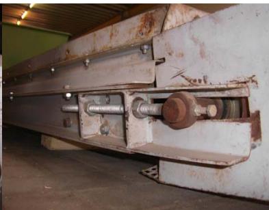
Umlenkseite mit Spannvorrichtung